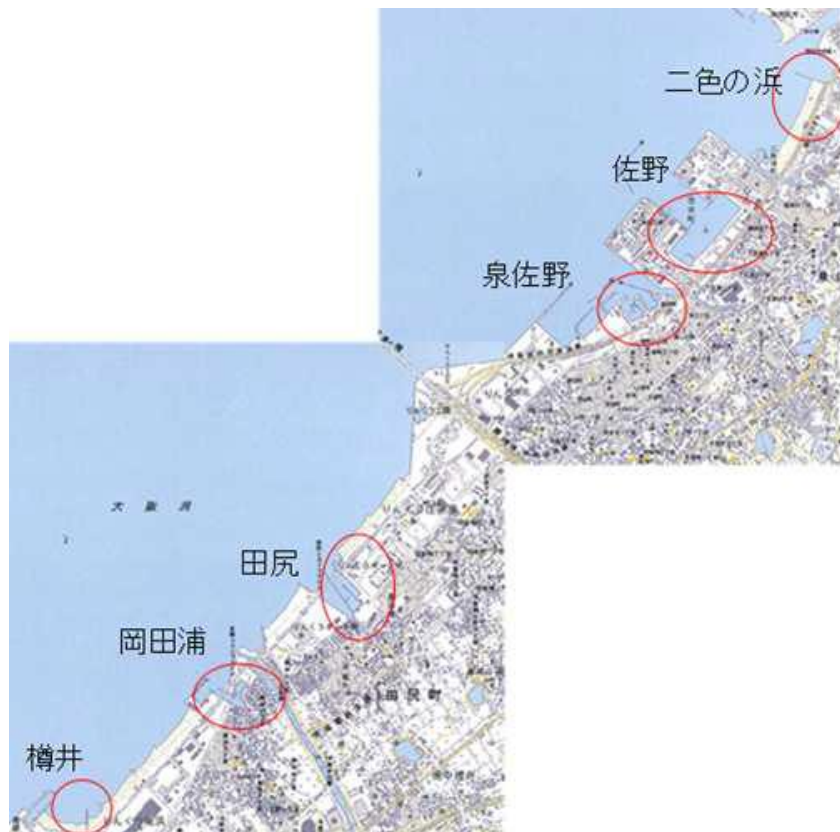
図-1.1 アマモ場造成実施海域

りんくう連絡協議会(りんくう5協：樽井、岡田浦、田尻、泉佐野、北中通の5漁協)は平成15年12月18日に田尻、岡田浦、樽井の漁港周辺でアマモが生育可能かどうかの調査(水質、光量、底質)を行うとともに、試験的に上記3海域にアマモ播種シート(32㎡)を敷設した。そして、翌年2月23日にアマモ播種シートでアマモが発芽しているのが確認されたことから、これ以降図-1に示すりんくう5協の各漁港周辺で小面積ながら毎年アマモ播種シートを敷設し、追跡調査が実施されてきた。