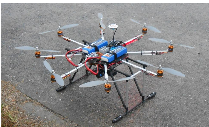
写真-3.1 使用するドローン