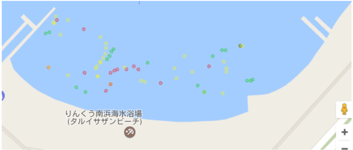
樽井(●:アマモ、●:アオサ、●:砂地)