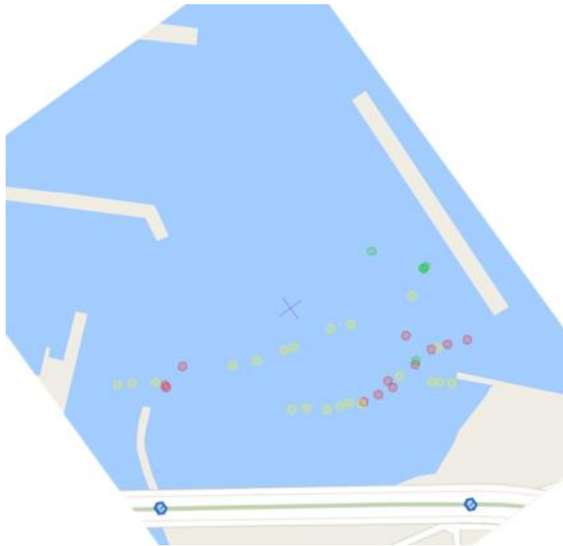
岡田浦(●:アマモ、●:アオサ、●:砂地)