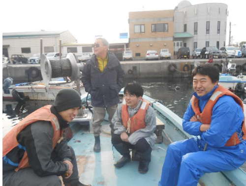
まだまだ寒い！(樽井)

ドローンによる空撮を取り止めたことで、乗船時間が約30分早まりました。各漁協の船長さんにその旨を伝え、早めに待機して頂けるようお願いしました。